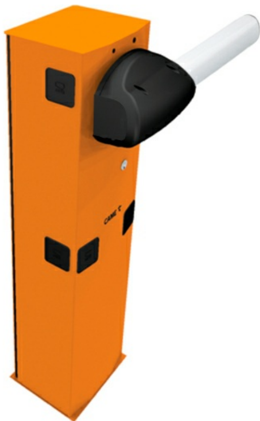
Фото Комплект шлагбаума GARD 3750 для правостороннего монтажа Classico G3750DX KIT

Отправьте запрос на коммерческое предложение и получите индивидуальные цены и сроки поставки