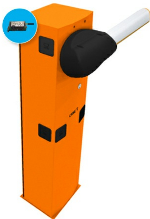
Фото Комплект шлагбаума GARD 3750 для правостороннего монтажа с управлением через приложение CAME G3750DX_GSM_KIT

Отправьте запрос на коммерческое предложение и получите индивидуальные цены и сроки поставки