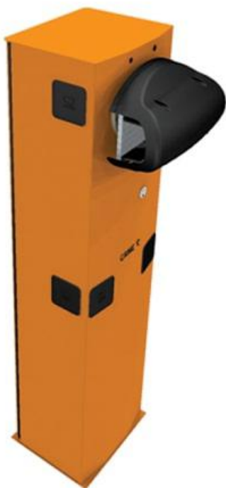
Фото Тумба шлагбаума из оцинкованной и окрашенной стали для левостороннего монтажа CAME 001G3750_SX

Отправьте запрос на коммерческое предложение и получите индивидуальные цены и сроки поставки