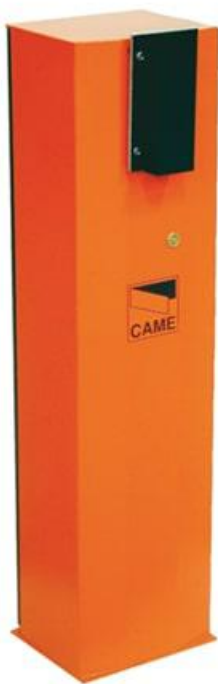
Фото Тумба шлагбаума из оцинкованной и окрашенной стали для левостороннего монтажа, класс защиты IP54 CAME 001G2500

Отправьте запрос на коммерческое предложение и получите индивидуальные цены и сроки поставки