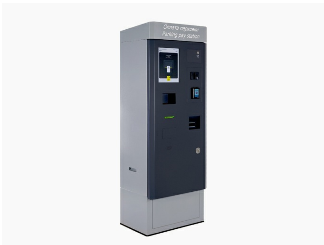
Фото Автоматический терминал оплаты CVS-P002221000 CAME CVS-P002221000

Отправьте запрос на коммерческое предложение и получите индивидуальные цены и сроки поставки