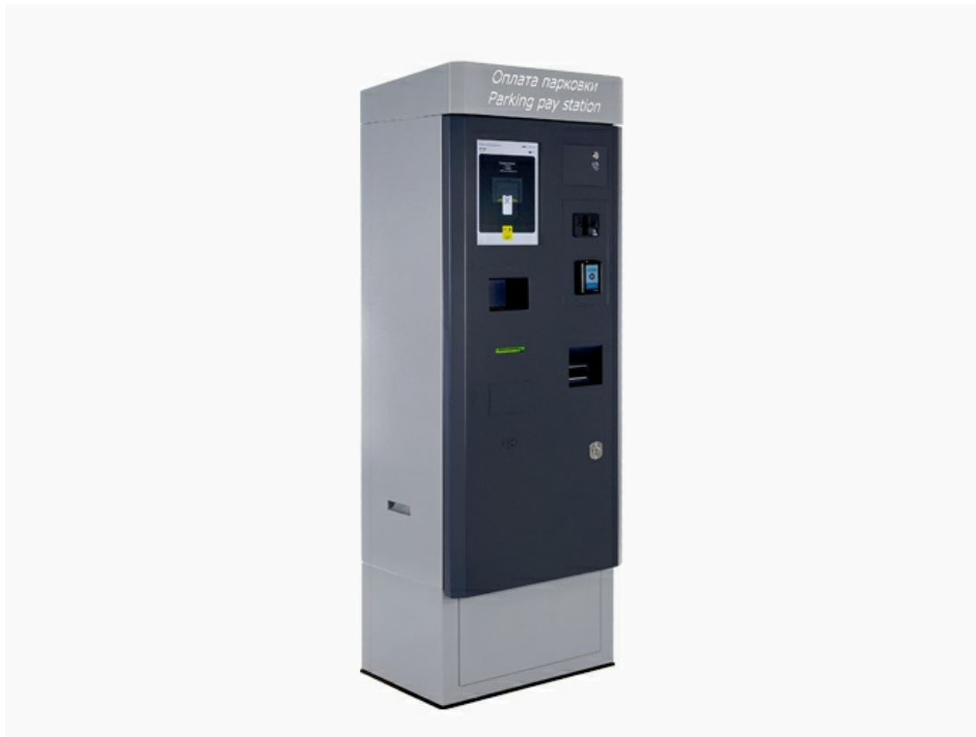
Фото Автоматический терминал оплаты CVS-P002021000 CAME CVS-P

Отправьте запрос на коммерческое предложение и получите индивидуальные цены и сроки поставки