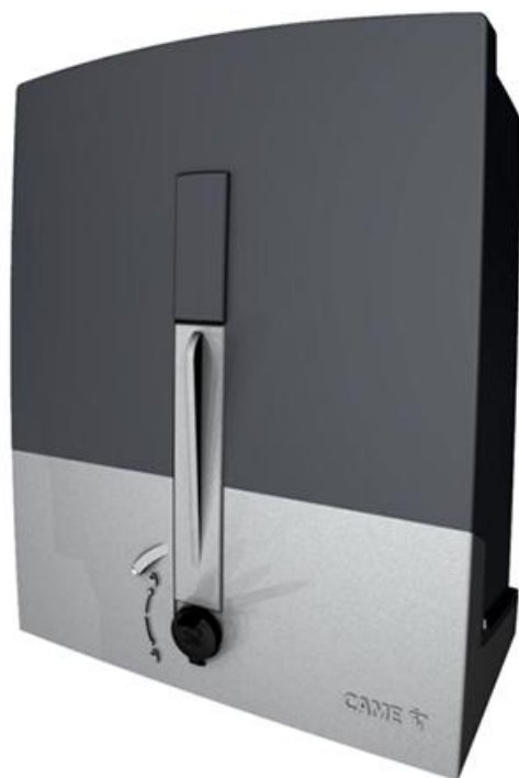
Фото Привод 24 В для откатных ворот. Встроенный блок управления ZN6 CAME 801MS-0140

Отправьте запрос на коммерческое предложение и получите индивидуальные цены и сроки поставки