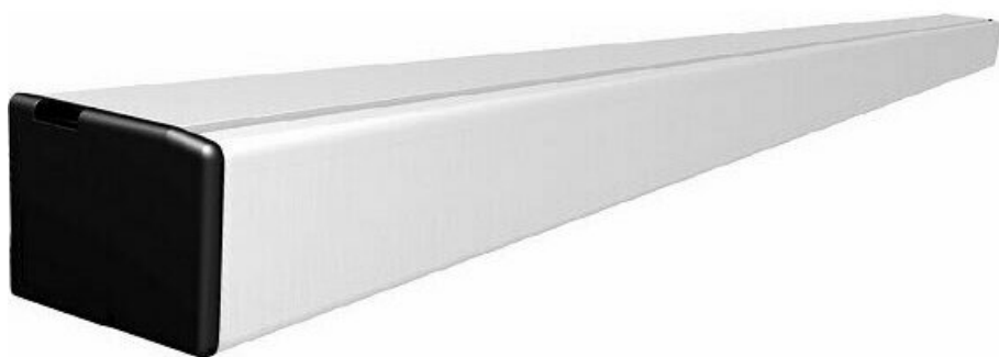
Фото CAME FLUO-SLM MAGNUM 818SL-0147 автоматика для раздвижных дверей

Отправьте запрос на коммерческое предложение и получите индивидуальные цены и сроки поставки