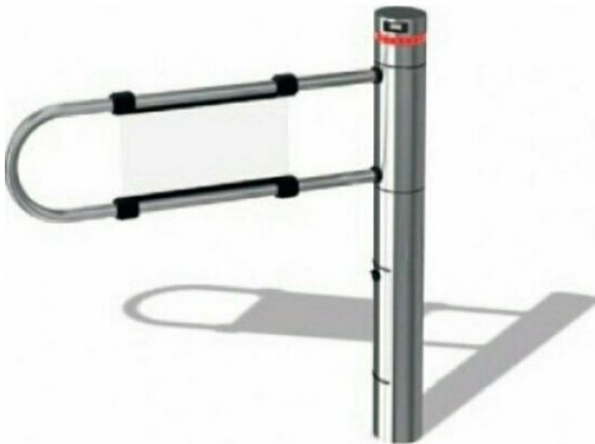
Фото CAME SALOON 40 (001PSSLN40-900) турникет-калитка

Отправьте запрос на коммерческое предложение и получите индивидуальные цены и сроки поставки