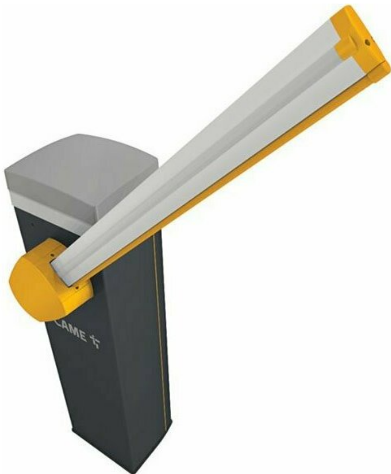
Фото CAME GARD PT 4 автоматический шлагбаум 4 м

Отправьте запрос на коммерческое предложение и получите индивидуальные цены и сроки поставки