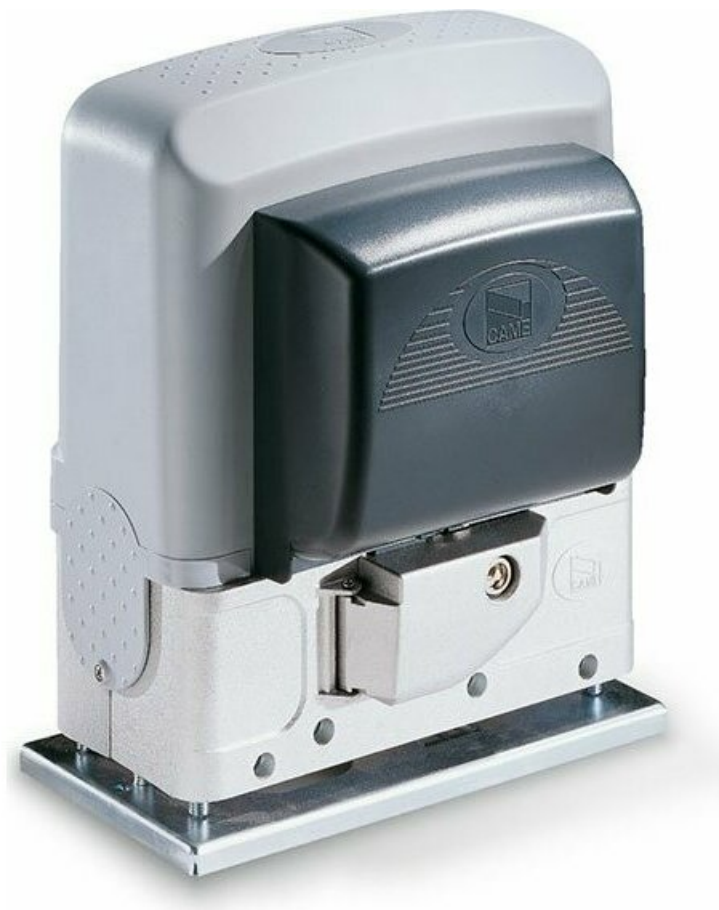
Фото CAME ВК-2200 привод для откатных ворот

Отправьте запрос на коммерческое предложение и получите индивидуальные цены и сроки поставки