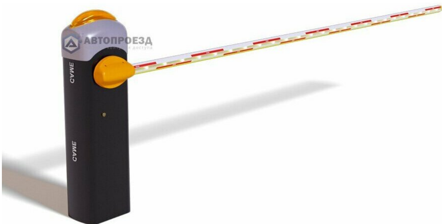
Фото CAME GARD 3000 (дюралайт) шлагбаум автоматический с подсветкой стрелы 3 м

Отправьте запрос на коммерческое предложение и получите индивидуальные цены и сроки поставки