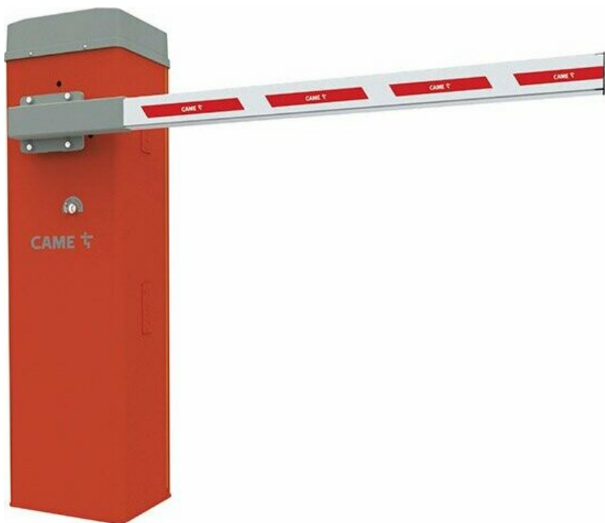
Фото CAME GLT COMBO KIT автоматический шлагбаум 4 м

Отправьте запрос на коммерческое предложение и получите индивидуальные цены и сроки поставки