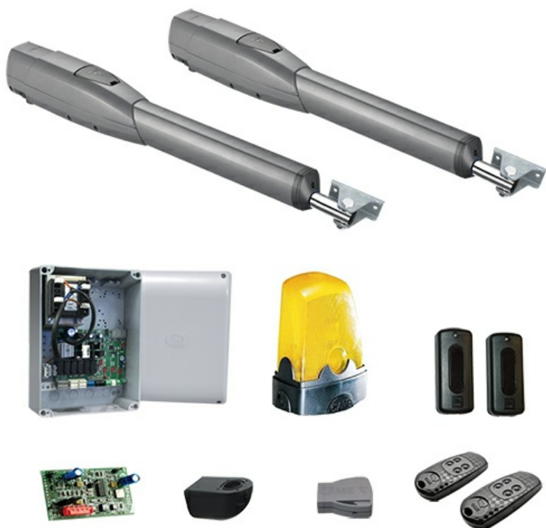
Фото Комплект автоматики для двухстворчатых распашных ворот на основе привода ATS30DGS с управлением через приложение CAME ATS3DGS_Wi-Fi_KIT

Отправьте запрос на коммерческое предложение и получите индивидуальные цены и сроки поставки