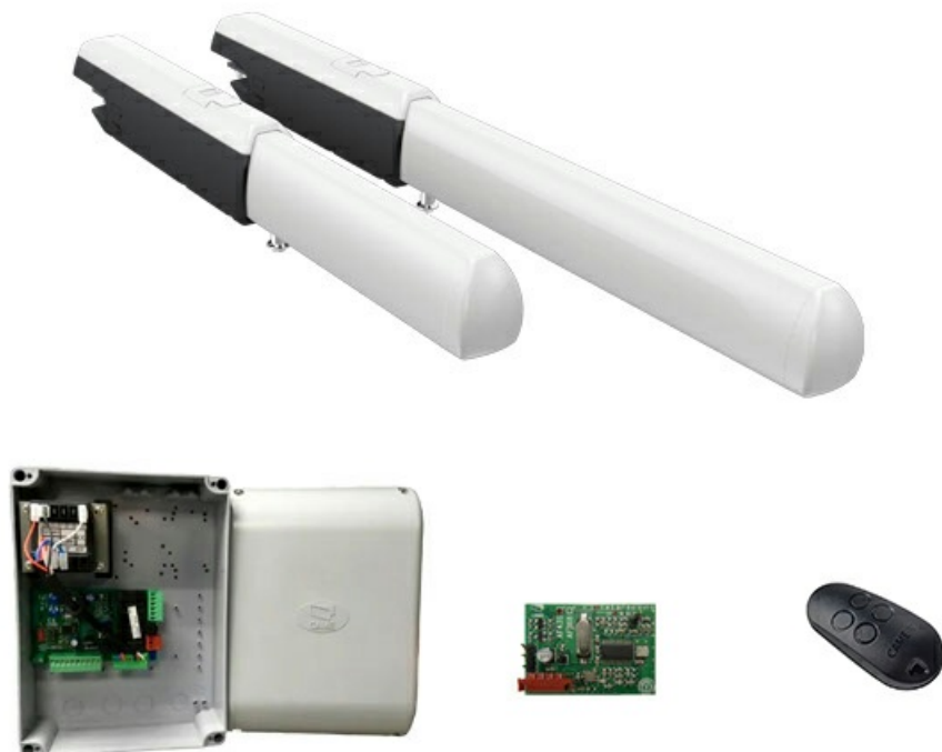
Фото Комплект автоматики для двухстворчатых распашных ворот на основе привода А3000А (блок управления ZF1N, радиоуправление с фиксированным кодом) CAME А3000А KIT

Отправьте запрос на коммерческое предложение и получите индивидуальные цены и сроки поставки