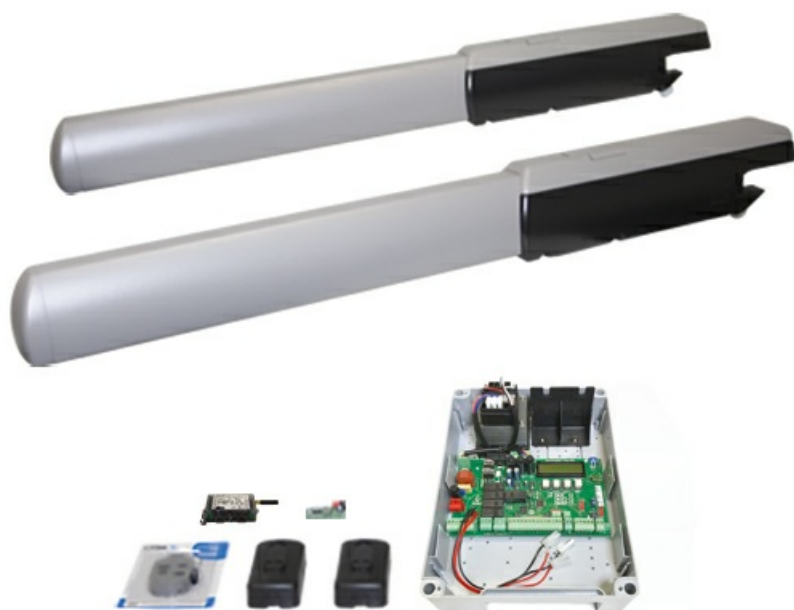
Фото Комплект автоматики для двухстворчатых распашных ворот на основе привода A3000A с управлением через приложение (блок управления ZM3E, фотоэлементы) CAME AT13000_GSM_KIT

Отправьте запрос на коммерческое предложение и получите индивидуальные цены и сроки поставки