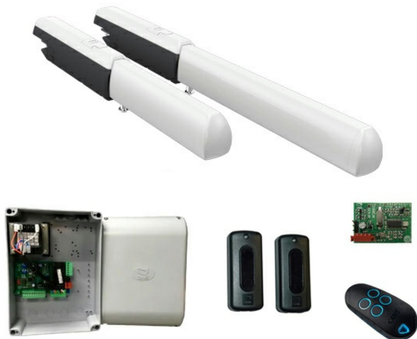
Фото Комплект автоматики для двухстворчатых распашных ворот на основе привода А3000А (блок управления ZF1N, радиоуправление с динамическим кодом, фотоэлементы) CAME АТI3000А RC combo KIT А3000А RC KIT

Отправьте запрос на коммерческое предложение и получите индивидуальные цены и сроки поставки