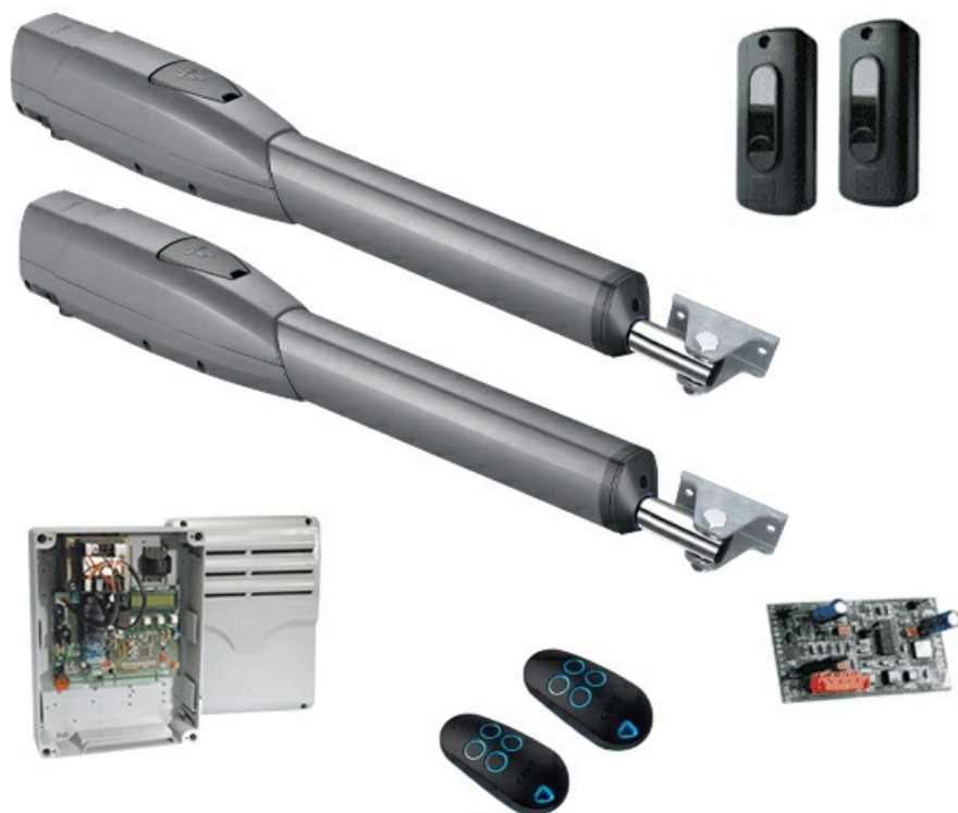
Фото Комплект автоматики для распашных ворот на основе привода ATS50AGS CAME 8K01MP-030

Отправьте запрос на коммерческое предложение и получите индивидуальные цены и сроки поставки