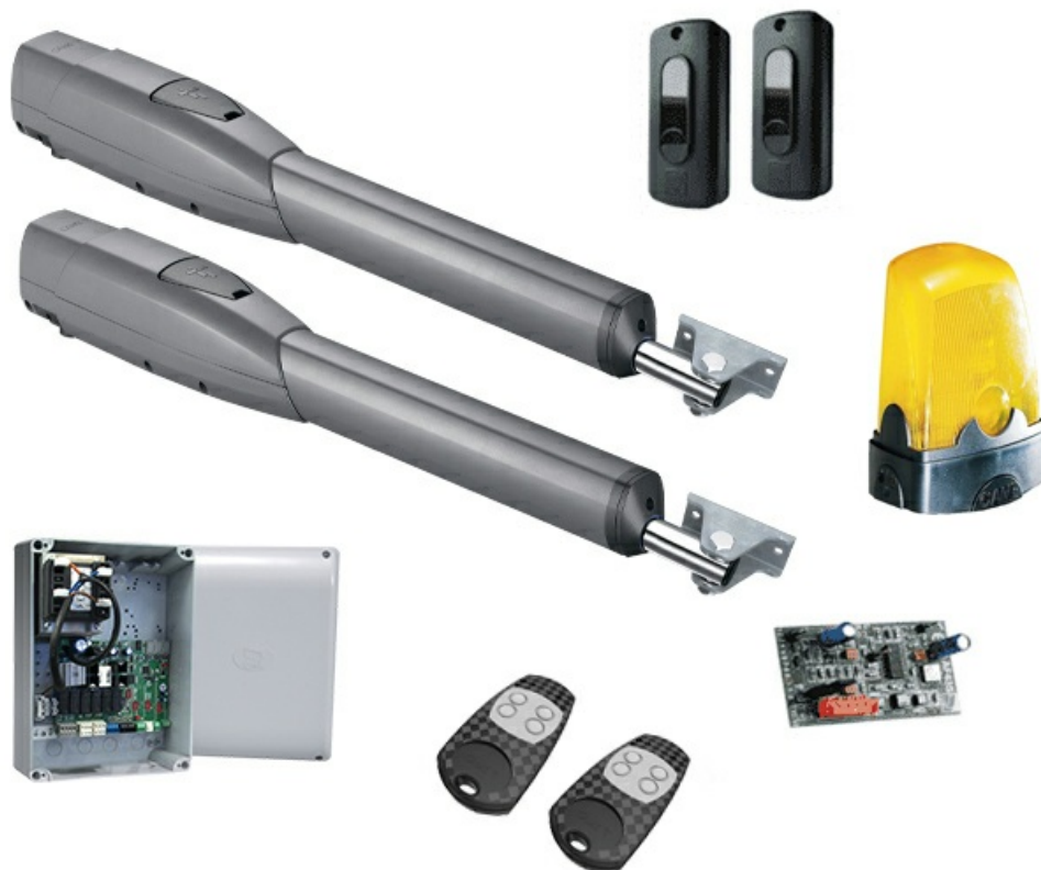
Фото Комплект ATS30DGS CAME 8K01MP-029

Отправьте запрос на коммерческое предложение и получите индивидуальные цены и сроки поставки