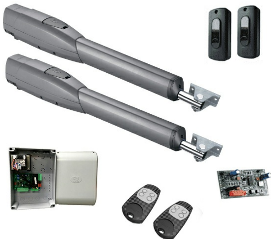
Фото Комплект ATS30AGS CAME 8K01MP-028

Отправьте запрос на коммерческое предложение и получите индивидуальные цены и сроки поставки