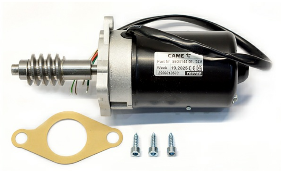
Фото Электродвигатель VXV04V V.1 в сборе CAME 88001-0284

Отправьте запрос на коммерческое предложение и получите индивидуальные цены и сроки поставки