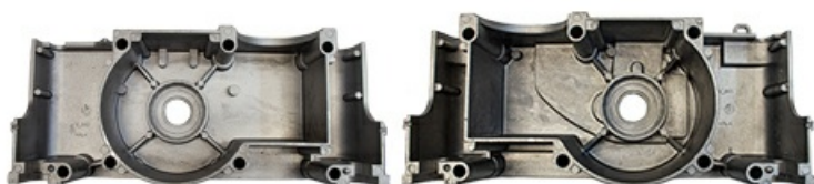
Фото Корпус редуктора VKS CAME 88001-0091

Тел: +7 499 681-75-28 | Email: sale@came-russia.ru | https://came-russia.ru