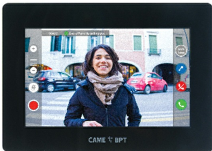
Фото Абонентское IP-устройство hands-free с сенсорным 5" дисплеем, локальным или POE питанием, редактор интерфейса Абонентские устройства CAME 840CH-0100

Отправьте запрос на коммерческое предложение и получите индивидуальные цены и сроки поставки