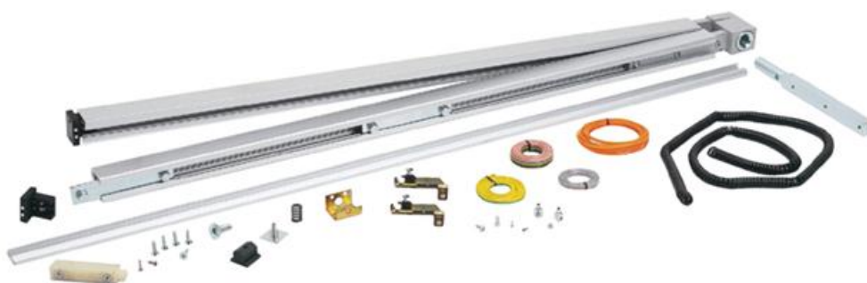
Фото Комплект "Антипаника" для 1 подвижной и 1 фиксированной створки шириной до 1100 мм CAME 818XC-0022

Отправьте запрос на коммерческое предложение и получите индивидуальные цены и сроки поставки