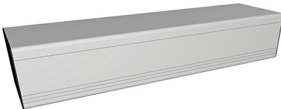
Фото FLUO-SWS3 SPRING, короб 540 ММ Автоматика для одностворчатой распашной двери, вес створки до 300 кг CAME 818SW-0140

Отправьте запрос на коммерческое предложение и получите индивидуальные цены и сроки поставки