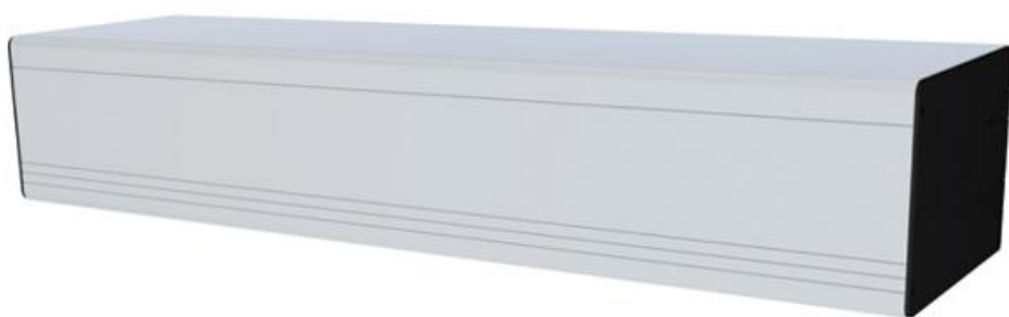
Фото Автоматика с пружинным механизмом для одностворчатой распашной двери, вес створки до 220 кг CAME 818SW-0050

Отправьте запрос на коммерческое предложение и получите индивидуальные цены и сроки поставки