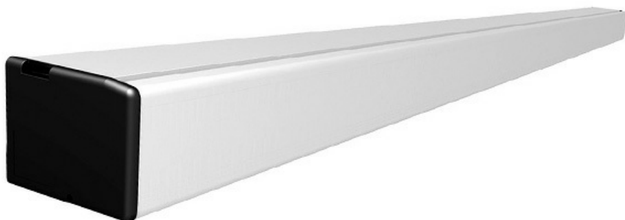
Фото Автоматика для одностворчатой раздвижной двери, ширина прохода до 1925 мм CAME 818SL-0096

Отправьте запрос на коммерческое предложение и получите индивидуальные цены и сроки поставки