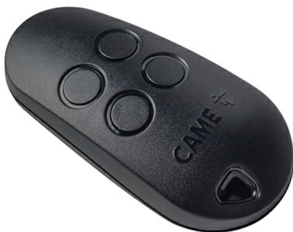
Фото Брелок-передатчик 4-х канальный, 433,92 МГц, с фиксированным кодом CAME 806TS-0310

Отправьте запрос на коммерческое предложение и получите индивидуальные цены и сроки поставки