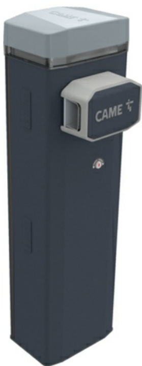
Фото Тумба шлагбаума из оцинкованной и окрашенной стали. Класс защиты IP54 CAME GGT40AGS 803BB-0160

Отправьте запрос на коммерческое предложение и получите индивидуальные цены и сроки поставки