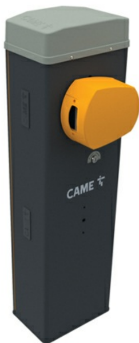
Фото Тумба шлагбаума из оцинкованной и окрашенной стали с возможностью установки дополнительных принадлежностей для проездов до 3,8 м, класс защиты IP54 GLS40AGS 803BB-0410

Отправьте запрос на коммерческое предложение и получите индивидуальные цены и сроки поставки