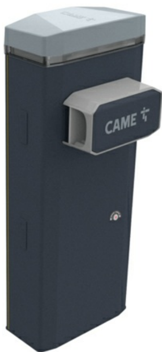
Фото Тумба шлагбаума из оцинкованной и окрашенной стали. Класс защиты IP54 CAME 803BB-0180

Отправьте запрос на коммерческое предложение и получите индивидуальные цены и сроки поставки