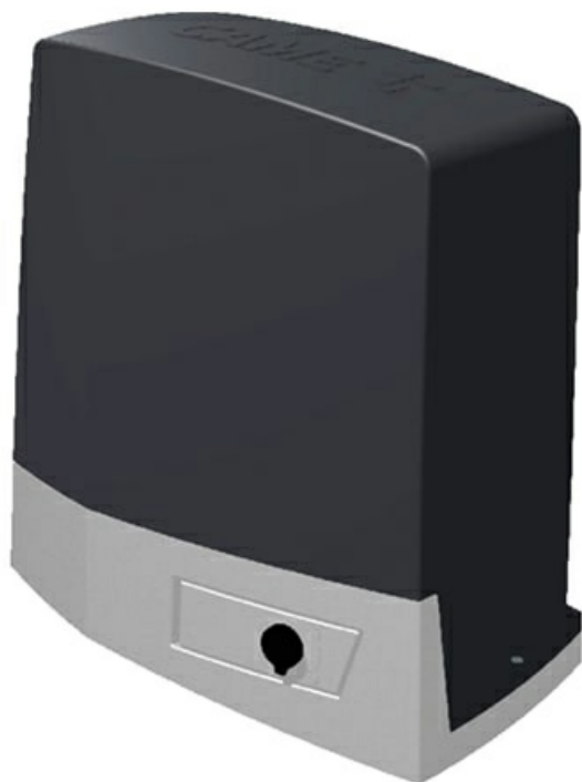
Фото Привод для откатных ворот BKV15AGE PLUS CAME 801ms-0350

Отправьте запрос на коммерческое предложение и получите индивидуальные цены и сроки поставки