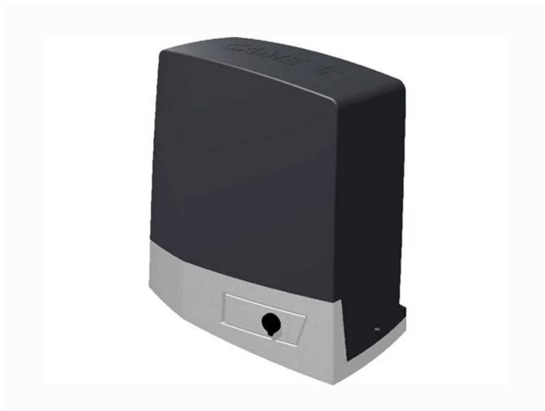
Фото Привод 36 В для откатных ворот. Встроенный блок управления ZN8 CAME BVK15AGS 801MS-0300

Отправьте запрос на коммерческое предложение и получите индивидуальные цены и сроки поставки