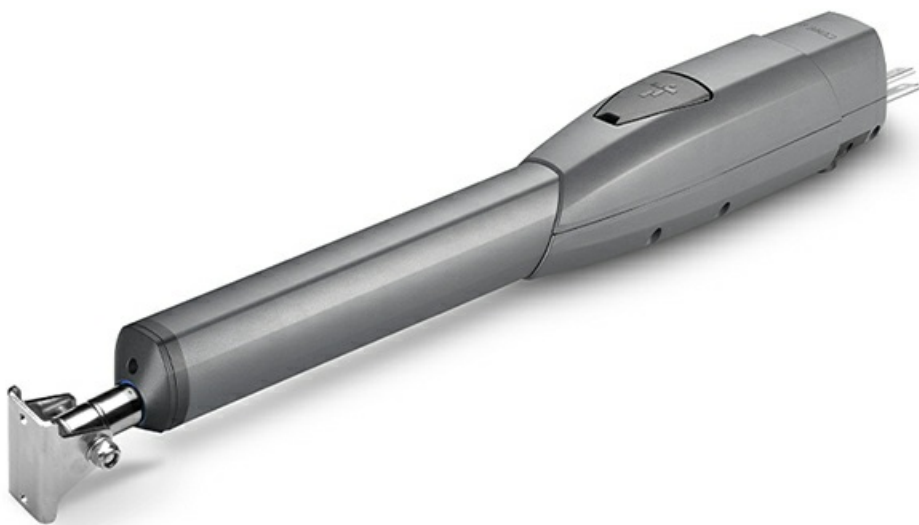
Фото Телескопический привод ATS50AGS для распашных ворот с встроенными концевыми выключателями CAME 801MP-0060

Отправьте запрос на коммерческое предложение и получите индивидуальные цены и сроки поставки