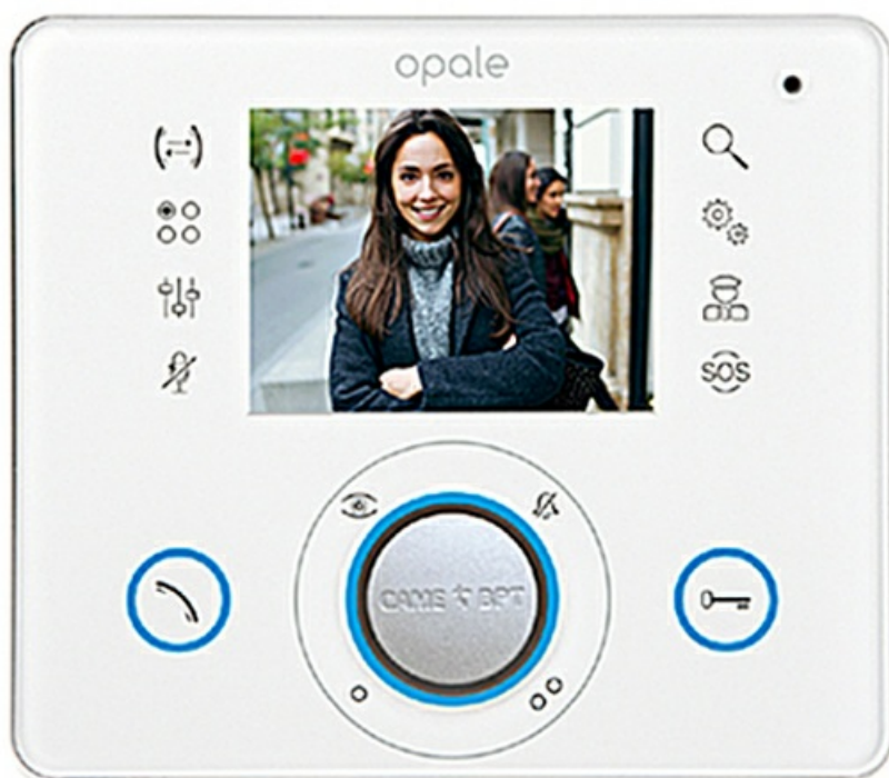
Фото Абонентское устройство OPALE с цветным дисплеем 3,5" и сенсорными клавишами белый лёд CAME 62100270

Отправьте запрос на коммерческое предложение и получите индивидуальные цены и сроки поставки