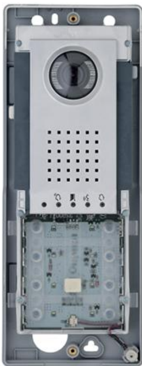
Фото Вызывная видеопанель THANGRAM DVC/IP ME CAME 62020340

Отправьте запрос на коммерческое предложение и получите индивидуальные цены и сроки поставки