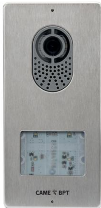
Фото Вызывная панель LITHOS LVC/01 CAME 62020070

Отправьте запрос на коммерческое предложение и получите индивидуальные цены и сроки поставки