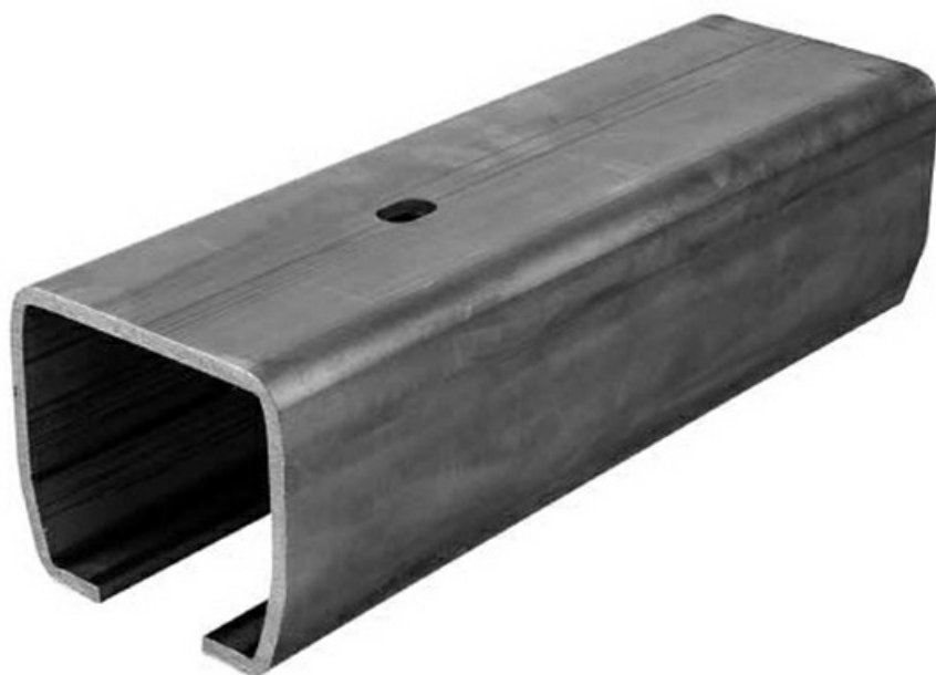
Фото Рельс направляющий 8 м CAME STAGE SB 8 1700999

Отправьте запрос на коммерческое предложение и получите индивидуальные цены и сроки поставки