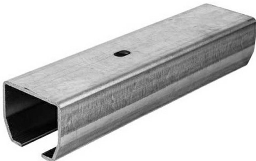
Фото Рельс направляющий S оцинкованный 8 м серия S CAME 1700998

Отправьте запрос на коммерческое предложение и получите индивидуальные цены и сроки поставки