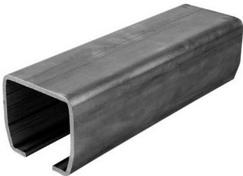
Фото Рельс направляющий STAGE LB 6 CAME 1700179

Отправьте запрос на коммерческое предложение и получите индивидуальные цены и сроки поставки