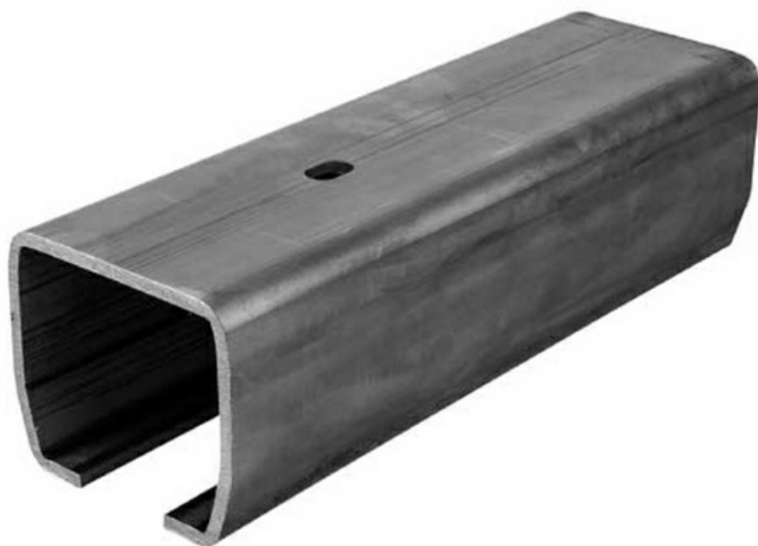
Фото Рельс направляющий 3 м, серия S CAME 1700167

Отправьте запрос на коммерческое предложение и получите индивидуальные цены и сроки поставки