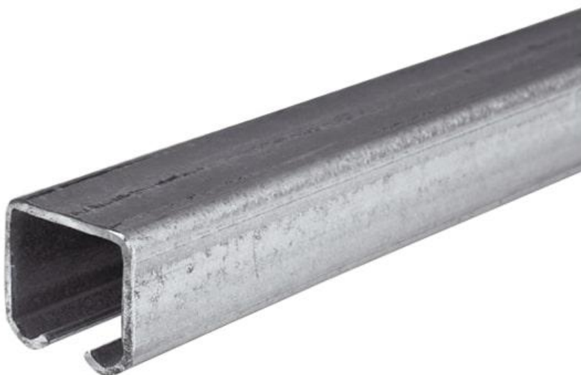
Фото Рельс направляющий подвесной STRELA 57-6 CAME 1700135

Отправьте запрос на коммерческое предложение и получите индивидуальные цены и сроки поставки