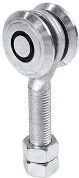
Фото Тележка с 2 колесами подшипниковая САСЕ 1700123

Отправьте запрос на коммерческое предложение и получите индивидуальные цены и сроки поставки