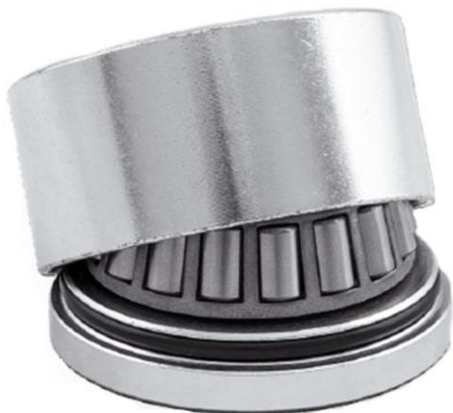
Фото Петля-шарнир нижняя АВ 50 L CAME 1700110

Отправьте запрос на коммерческое предложение и получите индивидуальные цены и сроки поставки