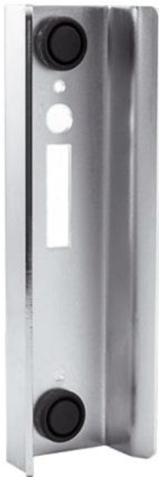
Фото Улавливатель для замка-крюка DOCK 62 CAME 1700056

Отправьте запрос на коммерческое предложение и получите индивидуальные цены и сроки поставки