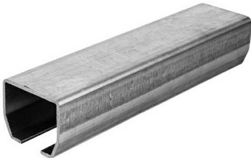
Фото Рельс направляющий LZ 3 оцинкованный CAME 1700019

Отправьте запрос на коммерческое предложение и получите индивидуальные цены и сроки поставки