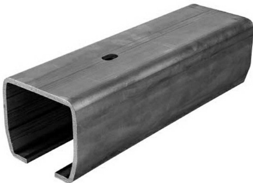
Фото Рельс направляющий 6 м CAME STAGE MB 6 1700011

Отправьте запрос на коммерческое предложение и получите индивидуальные цены и сроки поставки