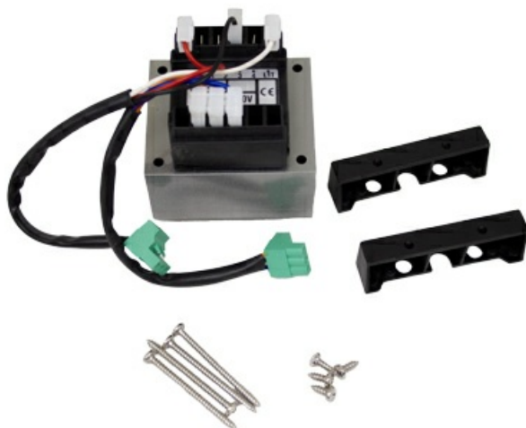
Фото Трансформатор ZM3 CAME 119RIR309

Отправьте запрос на коммерческое предложение и получите индивидуальные цены и сроки поставки