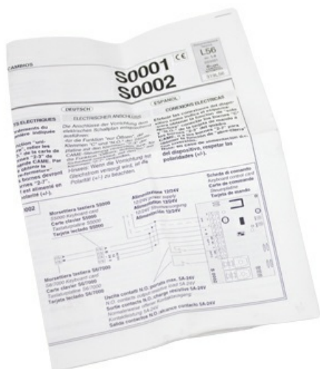
Фото Плата S0001 (арт119RIR118) CAME 119RIR118

Тел: +7 499 681-75-28 | Email: sale@came-russia.ru | https://came-russia.ru