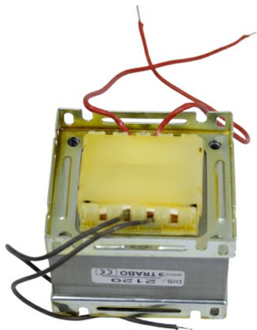
Фото Трансформатор ZN1 CAME 119RIR101

Отправьте запрос на коммерческое предложение и получите индивидуальные цены и сроки поставки